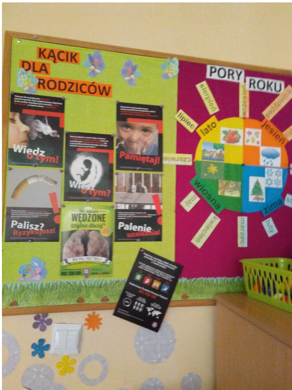
A to inne wytwory naszej pracy: