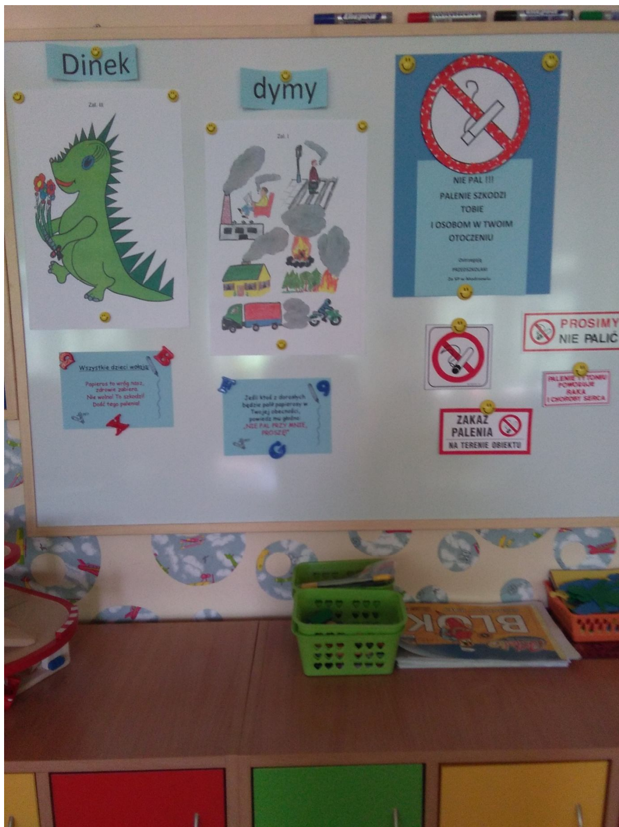
To nasz kącik dla rodziców: