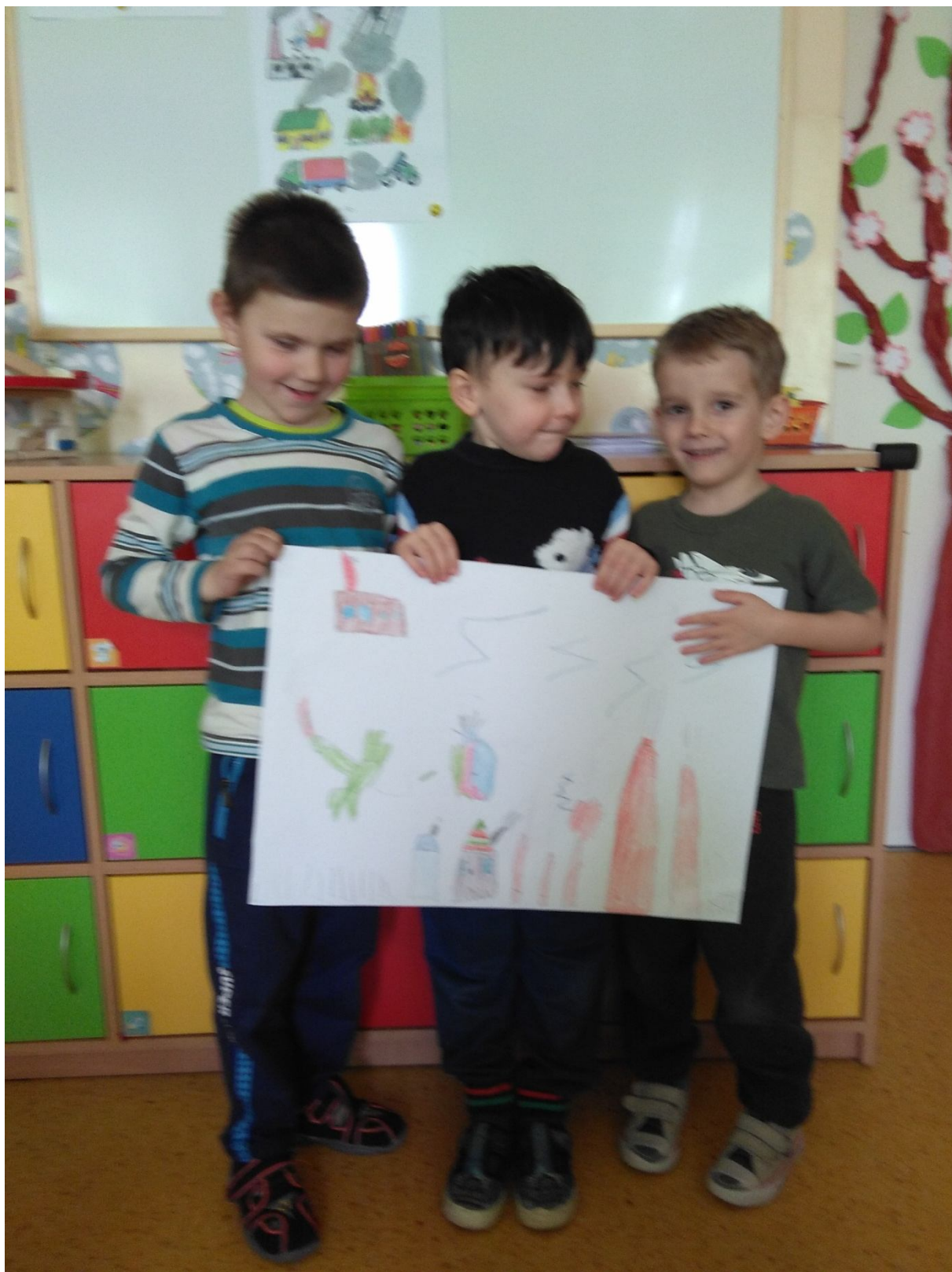
Co dymi i dlaczego dymi? Nasz plakat w Sali oraz nasza gazetka: